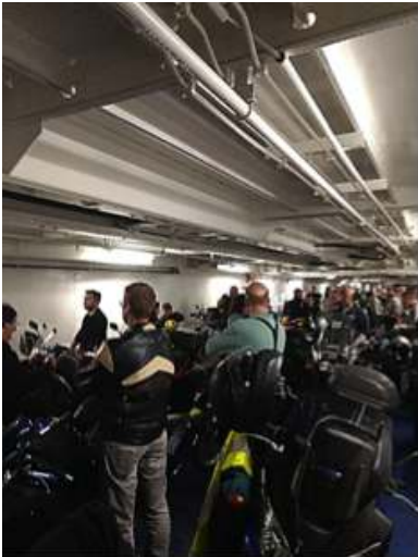
Drukke aan boord van de Ferry naar Newcastle

Ook is er door Schotland getoerd via de ferry IJmuiden-NewCastle . Een vreemde ervaring in het begin omdat je een motor grotendeels stuurt met je lichaam en dan is linksom een rotonde nemen een vreemde gewaarwording, dan slaan de stoppen in de bovenkamer een beetje door. In Engeland is er overigens op iedere straathoek wel een rotonde dus het went gelukkig snel.