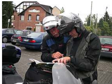
De wegenkaart werd regelmatig geraadpleegd.