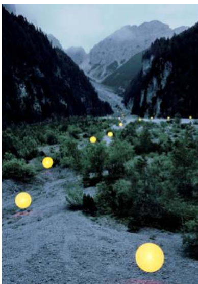
'Yellow dots #1'